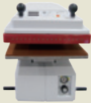
TP-700A 価格456,000円 (税抜)